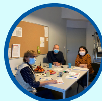
Formations des professionnel.le.s